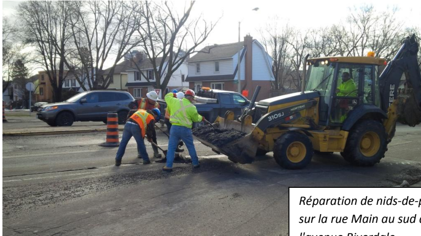
Réparation de nids-de-poule sur la rue Main au sud de l'avenue Riverdale.