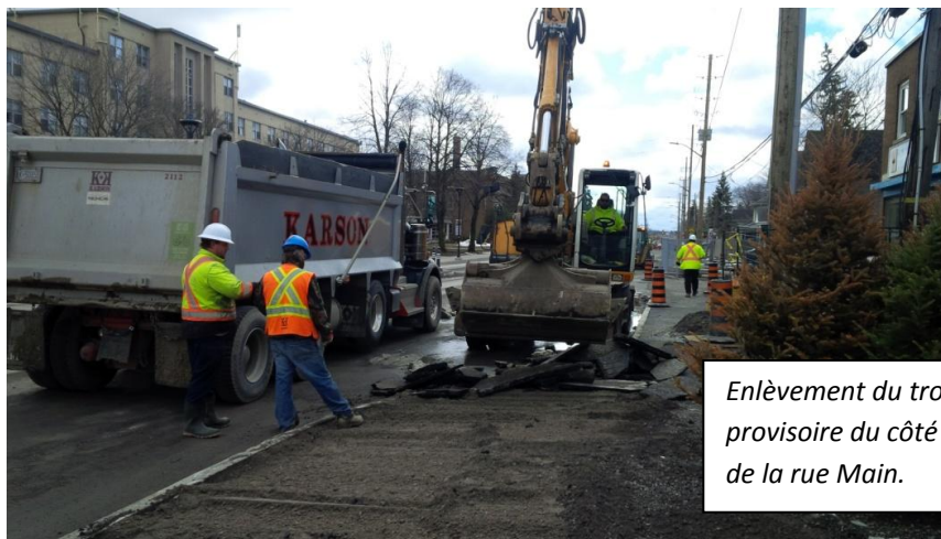
Enlèvement du trottoir provisoire du côté ouest de la rue Main.