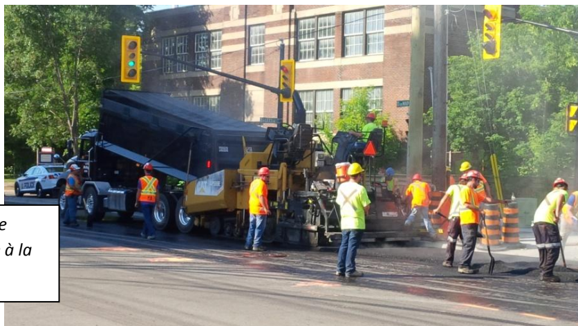
Pose de la dernière couche d'asphalte à la l'avenue Graham.