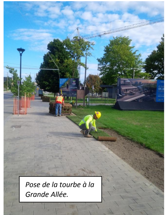
Pose de la tourbe à la Grande Allée.

Le pont McIlraith sera fermé par intervalles de 10 minutes de 19 h à 6 h du 6 au 8 septembre pour des travaux de réaménagement. Il sera possible d'y circuler après chacune de ces courtes périodes de fermeture. Ces travaux exécutés par intervalle reprendront toutes les deux semaines en soirée et pendant la nuit, et ce, jusqu'à la fin novembre.