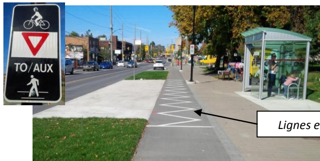
Lignes en zigzag