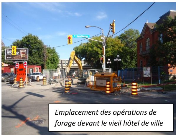
Emplacement des opérations de forage devant le vieil hôtel de ville

Une grosse conduite d'eau principale d'un diamètre de 1,22 mètre traverse la rue Main à la hauteur de l'avenue Hawthorne. Il s'agit de la principale conduite d'alimentation menant à l'extrémité est de la ville, qui achemine 1 500 litres d'eau par seconde. Le débit de cette conduite d'eau principale permettrait de remplir chaque jour 52 piscines olympiques. Un petit égout domestique (diamètre de 375 mm) circulant sous cette conduite devait être remplacé. Pour éviter d'endommager la conduite d'eau principale, l'égout domestique a été remplacé à l'aide de la méthode du cric et du forage. Au cours de cette opération, la conduite d'eau principale a été surveillée en permanence en raison des vibrations pouvant survenir pendant le tassement, afin de garantir son maintien en bon état.