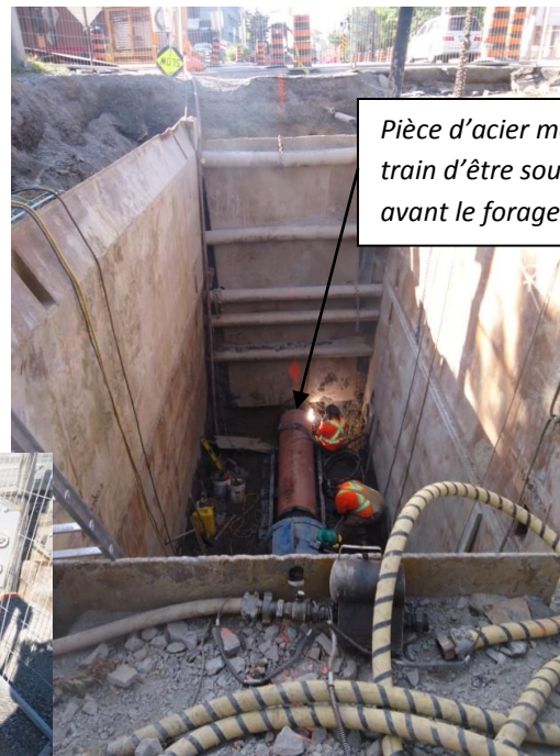
Pièce d'acier moulé en train d'être soudée avant le forage.